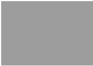
dr. [redacted] secretaris

Samengevat adviseert de Commissie het bezwaar tegen de toekenning van € 30.000,- kennelijk ongegrond te verklaren en het verzoek om aanvullende compensatie voor werkelijke schade in behandeling te nemen.